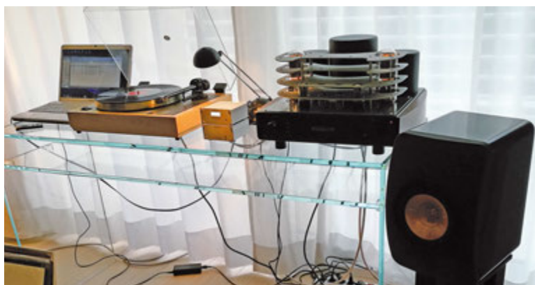
In dimostrazione nella sala M2Tech l'EVO PhonoDAC Two, convertitore A/D-D/A capace di gestire segnali DXD-DSD, qui abbinato al giradischi LinnSondek LP12 con braccio ProJect Carbon, testina Linn Adikt, ampli integrato Mastersound e diffusori KEF LS50.