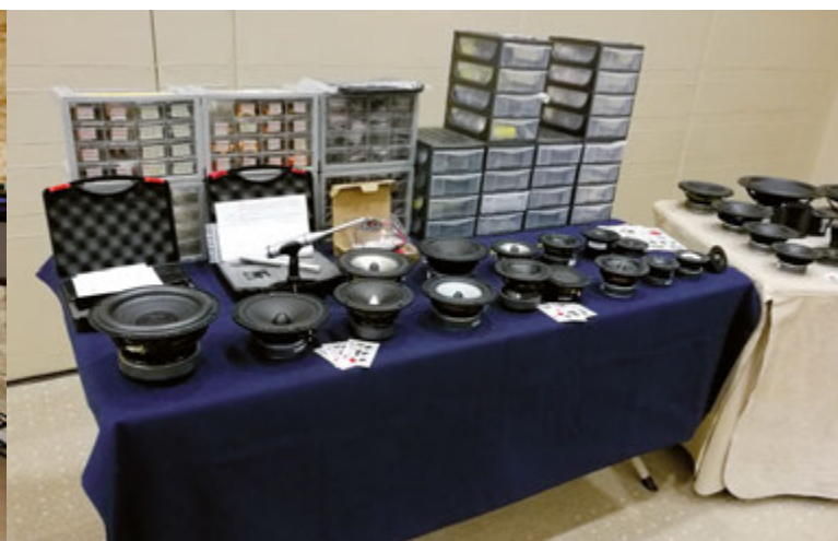
Una panoramica dei componenti proposti dalla Dibirama di Diego Sartori al suo debutto come espositore nella sala grande.