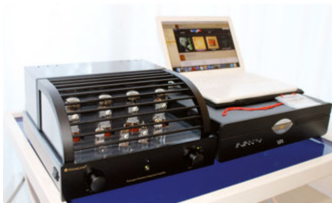
Valvole e sorgenti digitali nella suite di LP Audio, con un Mac Book abbinato al convertitore D/A del lettore CD YBA Heritage CD100, ampli integrato Primaluna Prologue e diffusori Elac BS403.