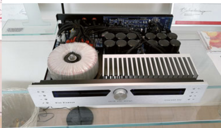
Il nuovissimo amplificatore integrato Blue Diamond di North Star Design era esibito dal suo progettista, l'ing. Giuseppe Rampino, in un sistema tutto toscano, con diffusori Rosso Fiorentino Giglio e lettore CD/DAC Blue Diamond.