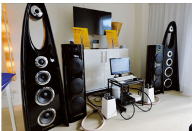
Sorgente digitale Mac Mini con DAC Volta Audio per gli originalissimi amplificatori mono Ulix IBR100 e diffusori Claravox Euphonia; il tutto connesso con cavi Shinpy.