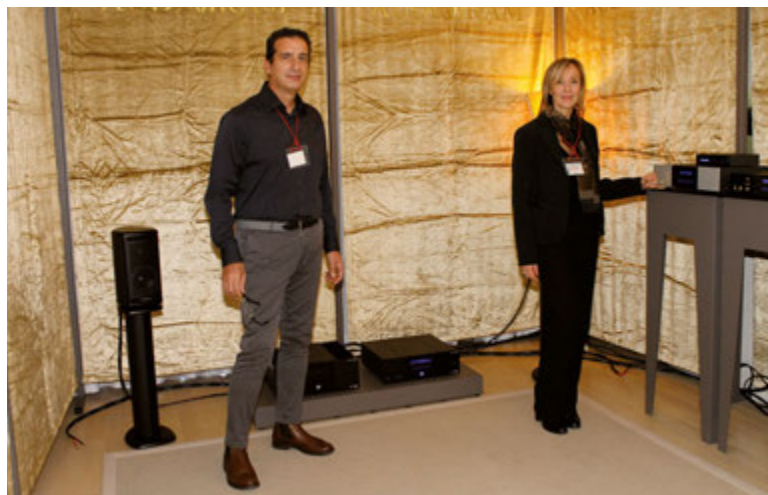
In una sala trattata con molta cura su tutte le pareti, il costruttore pisano Audiogram presentava un impianto con i suoi diffusori Alone, amplificatore integrato MB (MBS in alternativa) e DAC DA2 con segnale da sorgente digitale.