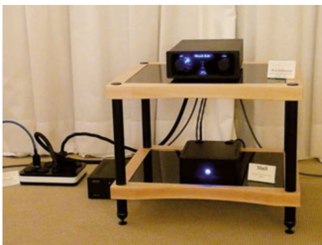
Novità assoluta per l'Italia, l'edizione mk2 dell'ampli inglese Edwards Audio IA2-R pilotava i diffusori Davis Olympia One Master prendendo segnale dallo streamer MES 5. Altra novità del distributore Audio Mondo i pregiati cavi Absolve Créations, degni complementi della multipresa di rete Vibex.