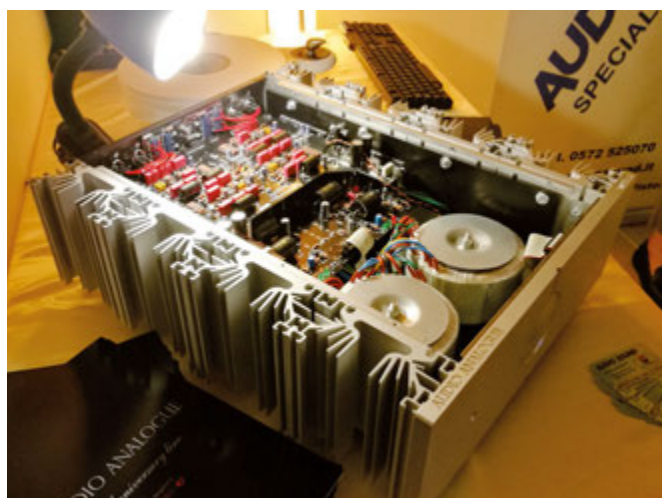
Decisamente intrigante l'amplificatore Maestro Anniversary di Audio Analogue esposto nella sala Audio Sound, dove suonava in coppia con i diffusori Astri Audio C3 Schedir e sorgenti analogiche e digitali tra cui i giradischi Funk Firm LSD e Pear Audio, il pre phono Perreaux VPI Audiant, il lettore CD Neodio ONE e la sorgente digitale Mac Mini con convertitore Audiolab M ONE DAC.