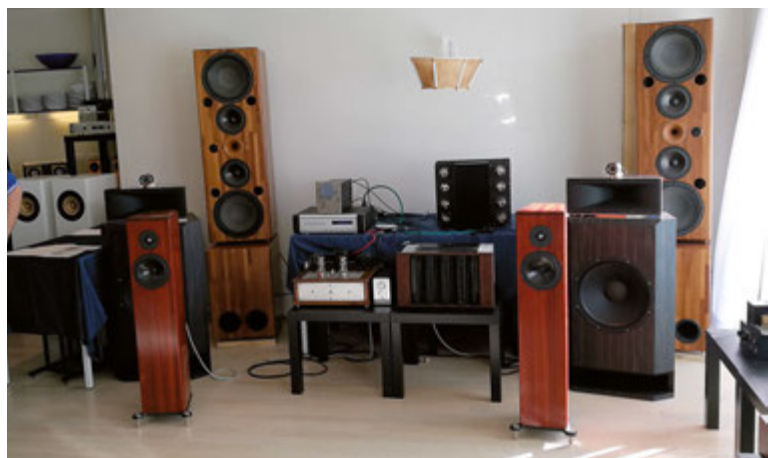
Nella sala Nuvectorclub si potevano ammirare componenti audio di ogni tipo, tutti rigorosamente autocostruiti con grande passione e impegno dai numerosi soci del club. Speriamo di presentarne presto almeno i più interessanti sulle pagine di questa rivista. Sono certo che farebbero la felicità di molti lettori.