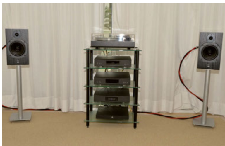
Nella suite 120 di Music For Life si poteva ammirare un impianto con diffusori ATC SCM11 e tutti componenti Linn Akurate: pre, finale e player digitale, nonché giradischi Sondek LP12 con braccio Ekos SE e testina Kandid.