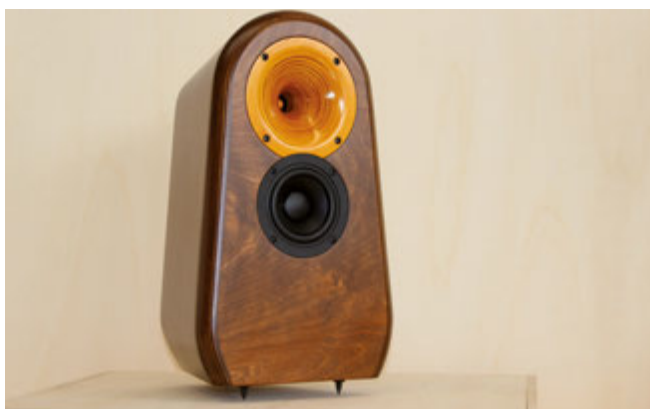
La Gallaudia di Cristiano Gallarotti realizza diffusori curatissimi in ogni dettaglio. Il modello VOX4 ha un midwoofer da 10 cm accordato a 50 Hz e driver in polimero caricato a tromba trattata a gommalacca "come i mobili d'arte". Abbinato all'ampli AM Audio A40 e sorgente digitale PC + DAC Pioneer U05, il suono risulta completo, non da minidiffusore.