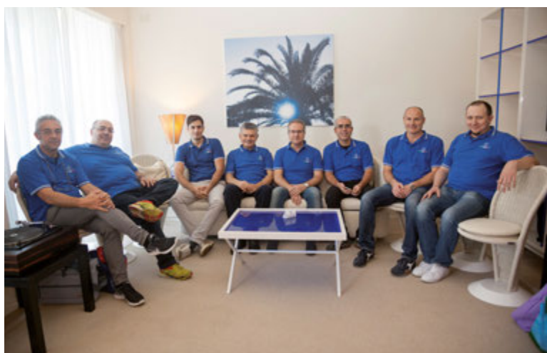
Doverosa foto di gruppo, anche se solo parziale, degli organizzatori dell'evento con l'inconfondibile divisa azzurra del Nuvisorclub.