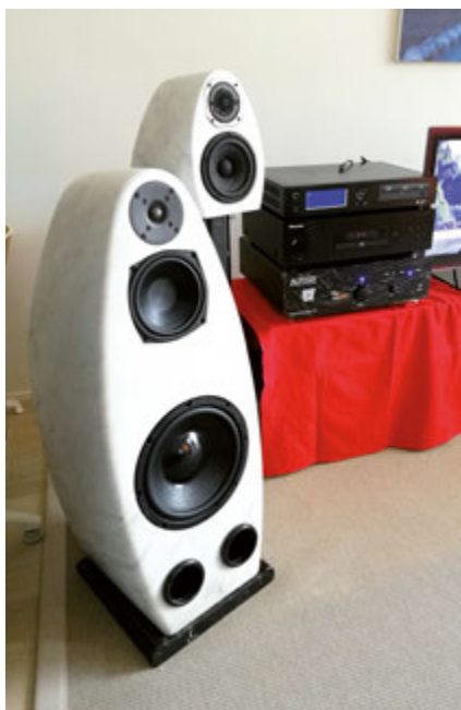
L'Audiovision di Camaiore esibiva diffusori con mobile in marmo cavato dal pieno, pilotati da un ampli integrato Altason S1 e doppia sorgente digitale Pioneer e Popcorn Audio.