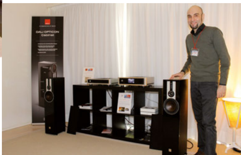
Forte dei premi EISA conferiti ai diffusori DALI Opticon e al player di rete Bluesound Node 2, il distributore nazionale Pixel Engineering esibiva questi prodotti con la superba amplificazione NAD Master Series ma anche un diffusore amplificato portatile DALI Katch dal suono sorprendente.